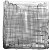
AccuPoint Örnekleyici Kalıbı